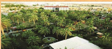
مناطق شرقی و شمال شرقی استان گسترده شده است.