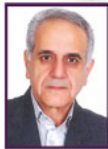
♦ رهبر هندسی ♦ مشاور مالیاتی اتاق بازرگانی، صنایع، معادن و کشاورزی کرمانشاه