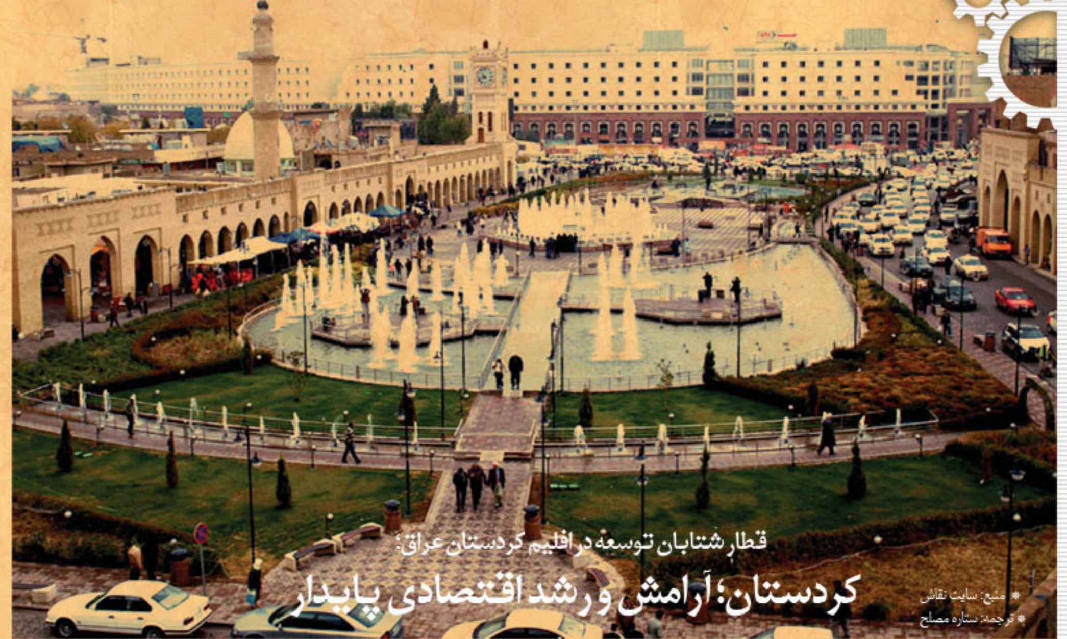
قطار شتابان توسعه در اقلیم کردستان عراق؛