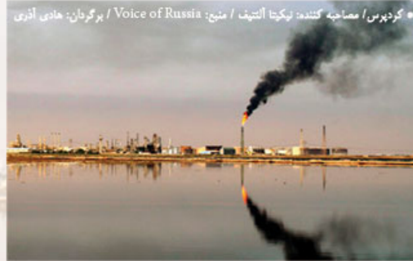
• گردپرس / مصاحبه کننده: نیکیتا آنتیف / منبع: Voice of Russia / برگردان: هادی آذری

برای خود درآمد زایی بیشتر کند اما با این حال هم آنکارا نمی‌تواند به سادگی از منابع نفتی تحت سلطه دولت عراق چشم‌پوشی کند و همچنین برای مدتی طولانی به نگرانی‌های بغداد پاسخ در خور توجهی ندهد!