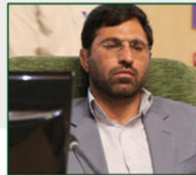
سید سعید حیدری طیب نماینده مردم کرمانشاه در مجلس شورای اسلامی

رئیس مجمع نمایندگان استان کرمانشاه یادآوری کرد: هر سه قوه باید در عین عمل به وظایف خود با سایر قوا همکاری و همدلی داشته باشند و به علاوه هریک استقلال خود را حفظ کنند.