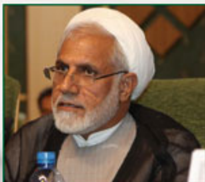
حجت الاسلام وحید احمدی رئیس مجمع نمایندگان استان کرمانشاه