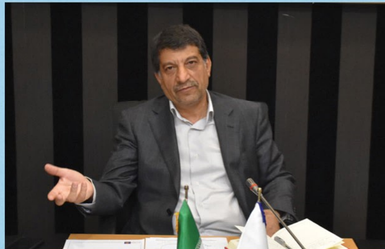
دبیرکل اتاق بازرگانی تاکید کرد:

پناهی همچنین بر لزوم استفاده از ظرفیت دانشگاه علوم پزشکی کرمانشاه برای آموزش دانشجویان عراقی نیز تاکید کرد.