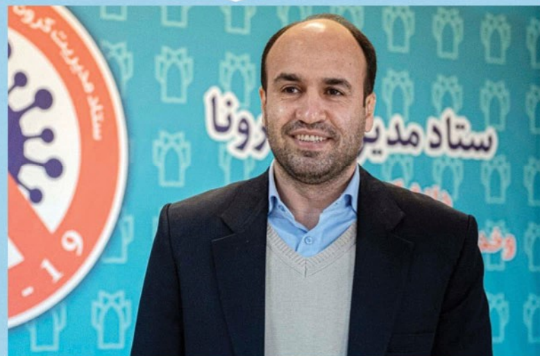
رئیس دانشگاه علوم پزشکی کرمانشاه: