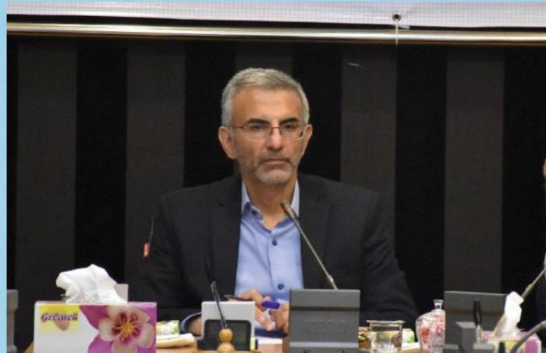
رئیس کمیسیون گردشگری اتاق کرمانشاه: