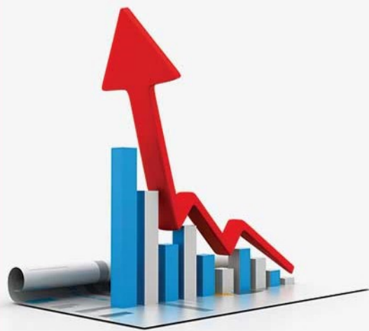
تعداد کارت های بازرگانی (صدوری، تمدیدی، ابطال و المثنی)